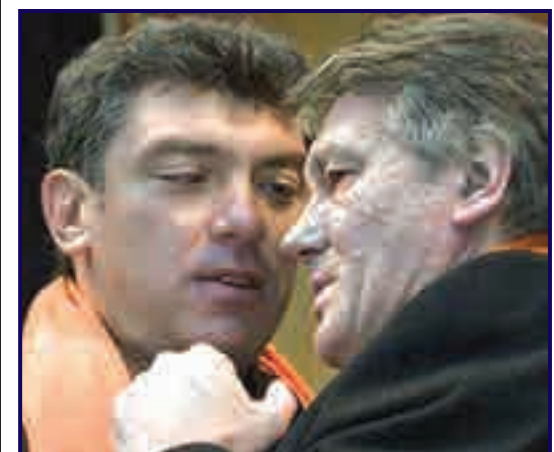
Борис Немцов и Виктор Ющенко

Простая логика говорит, что оба они должны пройти обследование на лепру. Здесь важно не перегнуть палку, но и не пропустить опасность.