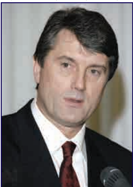
Несмотря на цветущий вид Виктор Ющенко к 2004 году болел уже десять лет

8 сентября прибывают журналисты: они отмечают неестественно розовый цвет лица кандидата и нечеткую дикцию, сам Ющенко жалует на сильную боль в спине, 9-го к этому прибавляется паралич лица. Больного срочно отправляют в Вену, в частную клинику, где