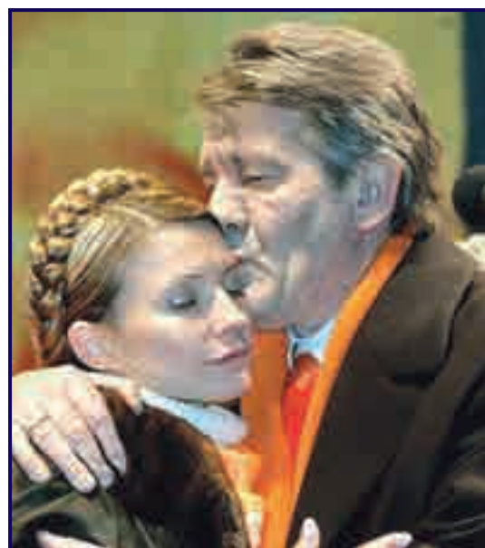
Проказой заразилась и Юлия Тимошенко

Только при лепре лицо меняется до неузнаваемости. Оно надувается, увеличиваются надбровные дуги, резко врезаются носогубные складки, нос утолщается... В ме-