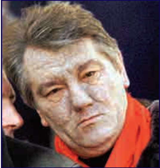
Только при лепре лицо меняется до неузнаваемости. Оно надувается, увеличиваются надбровные дуги, резко врезаются носогубные складки, нос утолщается... В медицине это называется «маска льва»

Начинает меняться кожа, но кожа не главное: у Ющенко сильнейшие боли в спине. Природа боли непонятна, пациент уже не может ходить, не может встать с кровати. Обезболи-