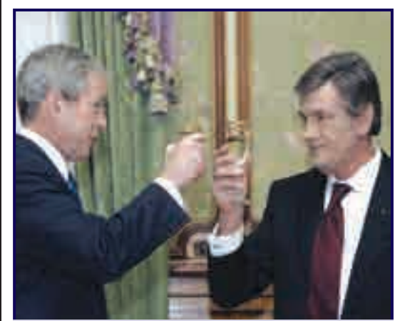
Джордж Буш и Виктор Ющенко

А вот теперь давайте поговорим и об этике. Имеем мы право обсуждать возможное заражение конкретного человека опасной инфекционной болезнью или нет. Кто имеет больше прав: человек на свою тайну личности — или общество на безопасность жизни людей?