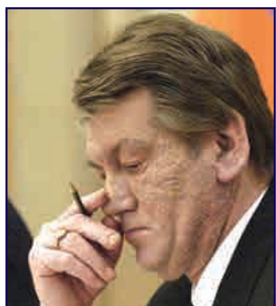
Только лепра поражает мочки ушей: они увеличиваются, напоминая сливу

Лепра вызывается микобактерией Ханзена и передается при разговоре. Сотни тысяч бактерий роятся вокруг больного и поражают тех, кто подходит ближе, чем на полметра метра. Человек может заразиться, но не заболеть. А может заболеть, но через двадцать-тридцать лет, когда роковая встреча уже сотрется из памяти. Всё это время здоровый носитель и лепрозный больной в инкубационном периоде будут распространителями инфекции.