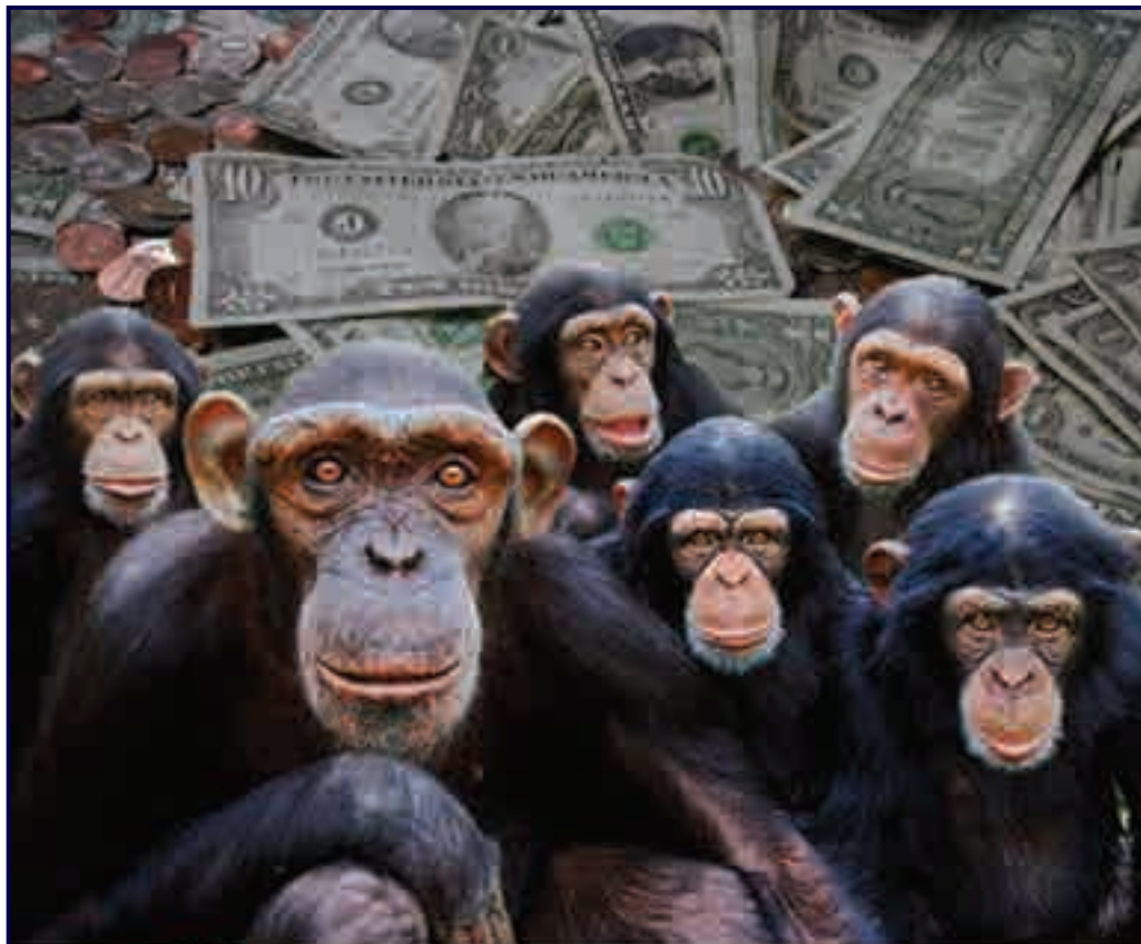
КАПИТАЛИЗМ - СОЦИАЛЬНАЯ ОРГАНИЗАЦИЯ ПРИМИТИВНЫХ

движение, которое подавалось как ленинский кооперативный план построения социализма, а на деле стало способом легализации теневых капиталов и сыграло роль троянского коня, изнутри подрывающего социалистическую экономику. Затем – акционирование предприятий, которое стало способом превращения социалистических предприятий в частнокапиталистические. Свобода на деле оказалась свободой торгашества, развития буржуазных отношений, а с ними и эксплуатации трудового народа. Свобода для него обернулась рабством.