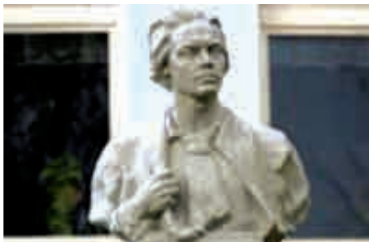
Памятник Кастусю Калиновскому (одному из лидеров антирусского восстания 1863 года) в Гродненской области

«Борьба с общерусским языком и культурой — это борьба против нашего единства, это стремление к разобщению. Сочетаясь с такими деструктивными явлениями, как мифо-