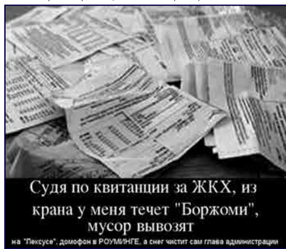
на «Лексусе», домофон в РОУМИНГЕ, а снег чистит сам глава администрации

Наиболее велика (не по слухам и сплетням, а по отчётам) удельная доля