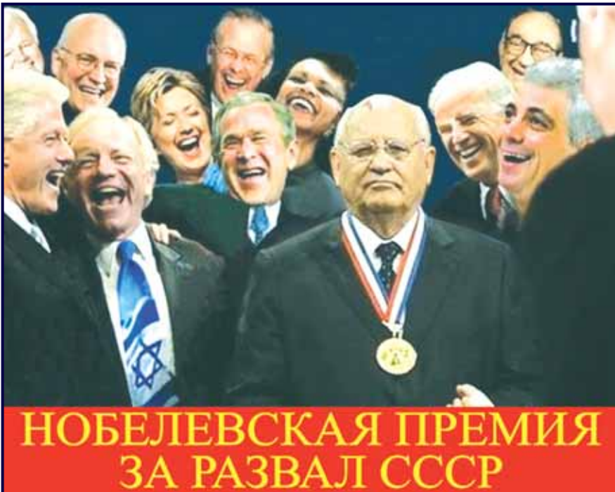
НОВАЯ НОБЕЛЕВСКАЯ ПРЕМИЯ ЗА РАЗВАЛ СССР

В содержательном плане стратегия включала и включает до сих пор следующее: