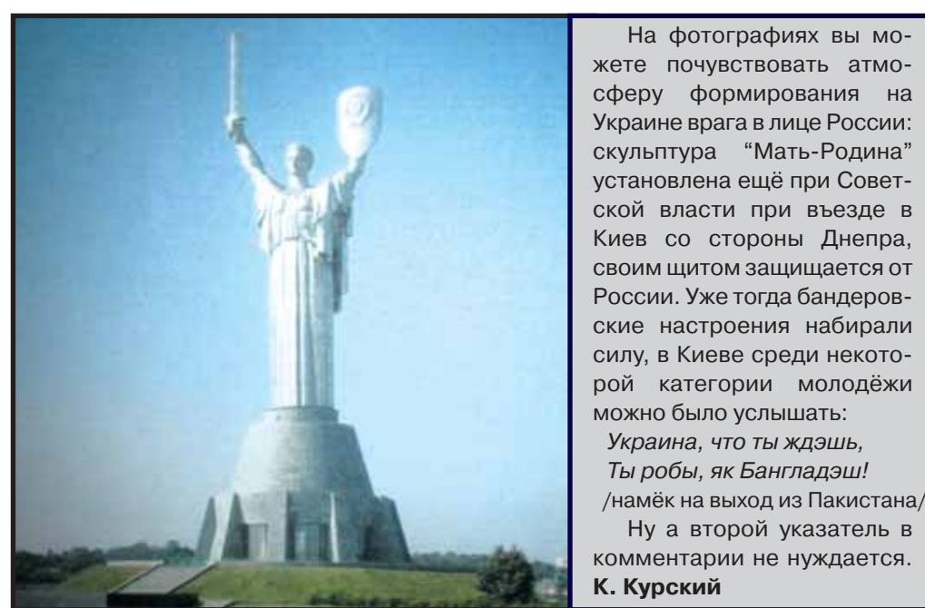
На фотографиях вы можете почувствовать атмосферу формирования на Украине врага в лице России: скульптура «Мать-Родина» установлена ещё при Советской власти при въезде в Киев со стороны Днепра, своим щитом защищает от России. Уже тогда бандеровские настроения набирали силу, в Киеве среди некоторой категории молодёжи можно было услышать: Украина, что ты ждэш, Ты робы, як Бангладэш! /намёк на выход из Пакистана./ Ну а второй указатель в комментарии не нуждается. К. Курский

Родиной и главным источником украинского национализма всегда была подневольная Галичина, а главной составляющей галицко-украинского национализма изначально была ненависть к Польше, а уже потом к России. Именно ненависть к порабощателям стала основой украинской национальной идеологии. Стоял, пыльный и бессильный скрежет зубов подневольного украинца – «крипака» – вот что со времён крепостного Тараса Шев-