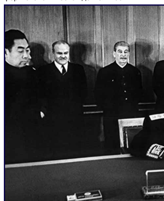
Подписание Договора о дружбе, союзе и взаимопонимании между СССР и КНР.

Советский специалист с группой китайских работников на электростанции в провинции Хэйлуцзянь.