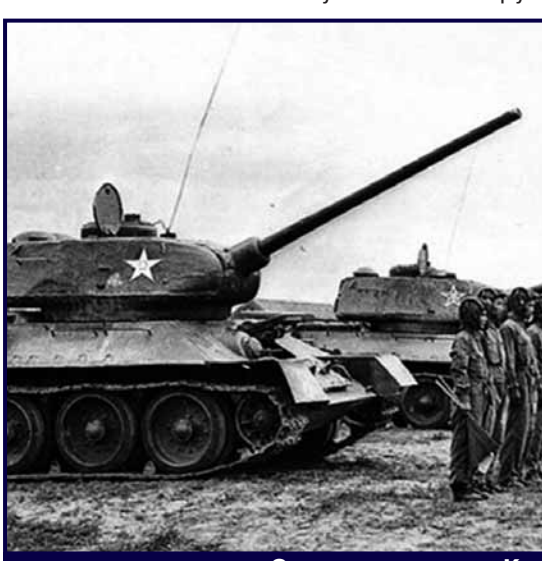
Советские танки в Китае

Подписание Договора о дружбе, союзе и взаимопонимании между СССР и КНР.