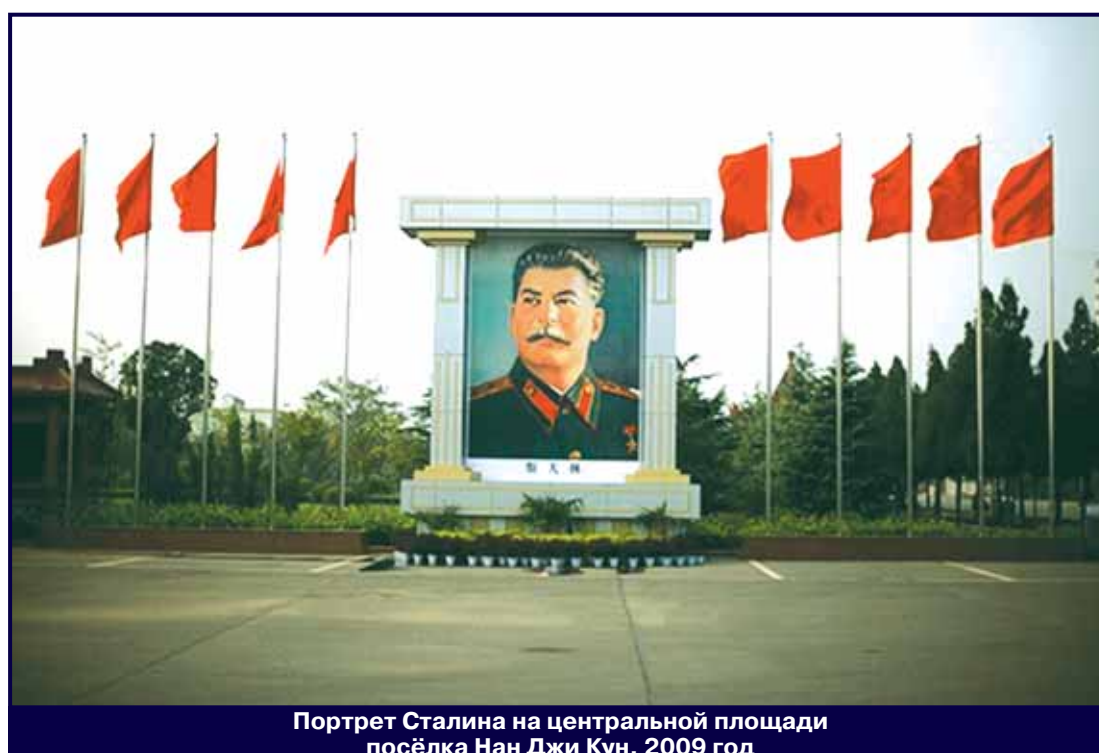
Портрет Сталина на центральной площади посёлка Нан Джи Кун, 2009 год

Если обратиться к собственно Китаю, то союз с СССР дал ему возможность практически впервые за столетие объединить страну, прекратить многолетние внутренние войны и остановить нарастающую деградацию. КНР рассматривалась в сталинском СССР как основной союзник, причём союзник мощный, обладающий собственными интересами. Здесь роль и вес Китая