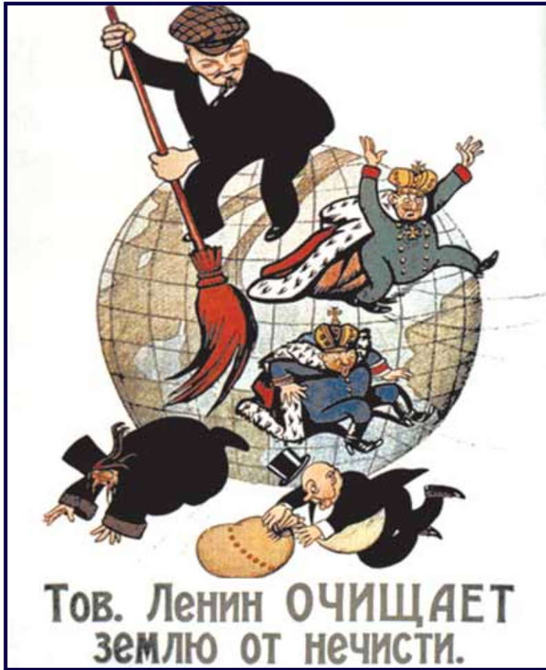
Тов. Ленин ОЧИЩАЕТ землю от нечисти.