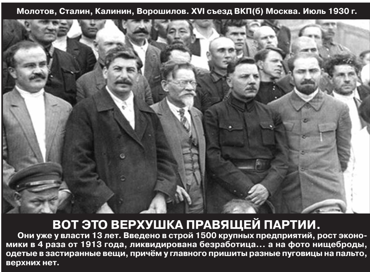
Молотов, Сталин, Калинин, Ворошилов. XVI съезд ВКП(б) Москва. Июль 1930 г.