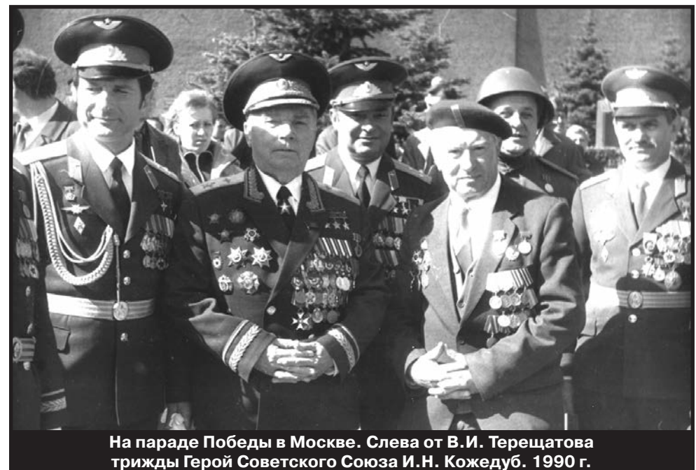
На параде Победы в Москве. Слева от В.И. Терещатова трижды Герой Советского Союза И.Н. Кожедуб. 1990 г.