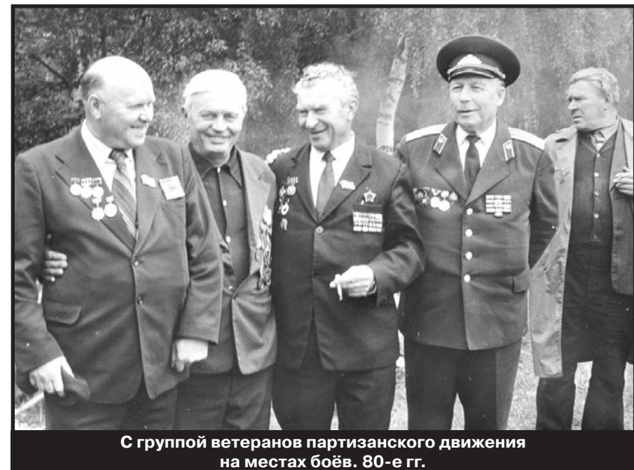
С группой ветеранов партизанского движения на местах боёв. 80-е гг.