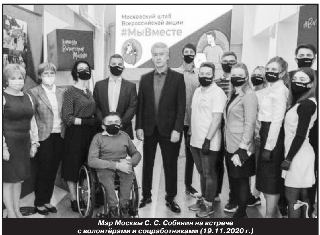
Мэр Москвы С. С. Собянин на встрече с волонтерами и соцработниками (19.11.2020 г.)

Что такое вообще позор? Сегодня уже и про позор надо говорить специально, потому что уже и это очень многие забыли и просто не понимают, о чём идёт речь.