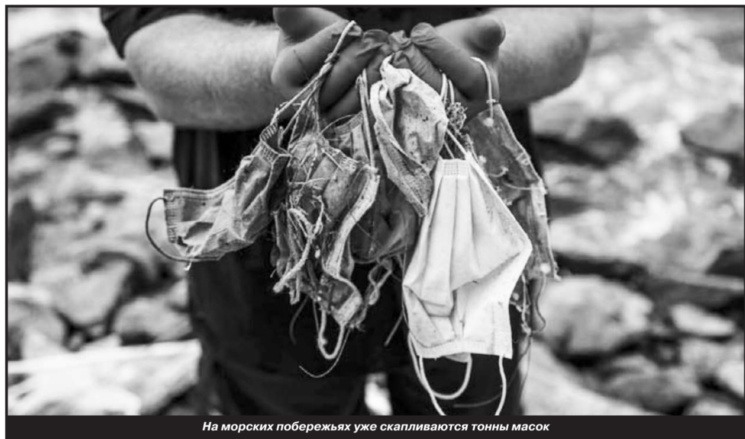
На морских побережьях уже скапливаются тонны масок

Помимо индивидуальных фобий бывают и коллективные страхи, подогреваемые извне. Сейчас в народ вбрасывает много дезинформации относительно пандемии. По сети и сарафанному радио гуляет множество ковидных фейков и городских легенд об якобы отравленных масках, которые раздают волонтеры, и о самолётах, которые разбрызгивают вирус. И хотя власти активно опровергают подобную информацию, градус тревожности в обществе очень высок, и многие этим слухам верят. В некоторых городах, например, в Красноярске, так называемые ковиддиссиденты даже вышли на митинг. Многие к-диссиденты считают, что приказ носить маску антинароден – это способ заткнуть общественную рот и сделать «псами режима».