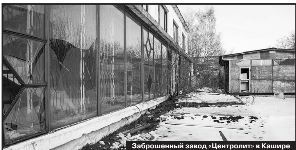
Заброшенный завод «Центролит» в Кашире

и дверные ручки-скобы, печные вьюшки и задвижки. Новые производства старались размещать не в ущерб существующим и под цеха, например, было отдано в том числе помещение столовой.