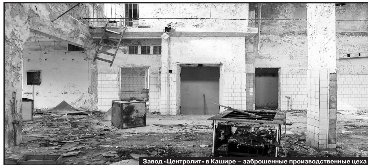
Завод «Центролит» в Кашире – заброшенные производственные цеха

Вот только грандиозным планам не суждено было сбыться, и на 2017 год Каширский литейный завод «Центролит» закрывается с отрицательной стоимостью активов и чистым убытком в 242 миллиона рублей только за последний год работы. Потом, конечно же, прошла целая схема их хитрых ходов, в результате которых собственники предприятия