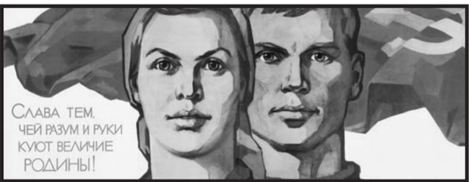
СЛАВА ТЕМ, ЧЕЙ РАЗУМ И РУКИ КЛУТ ВЕЛИКИЕ РОДИНЫ!

Нужно поднять голос за Идею, за Русскую общину, или коммуно справедливую народоправия, которую некогда утверждал на планете Будда, а потом и Махатма Ленин. Необходимо всенародно строить эгрегор Нового Мира — Советский Союз на новом более качественном уровне, с учётом всех прежних достижений и ошибок. Возьмём мировую пролетариата учил, что идея становится силой, когда она овладевает народом. А Сталин продолжил, что идея сильнее оружия! Народ захотел «западного рая», и СССР был разрушен. Но история не идёт вспять, потому Советский Союз будет освобождён тогда, когда идея освобождения Родины и восстановления Страны Советов завладеет народными массами.