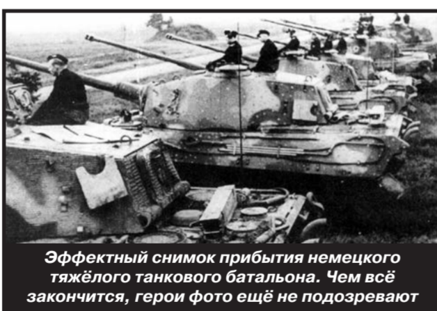
Эффективный снимок прибытия немецкого тяжёлого танкового батальона. Чем всё закончится, герои фото ещё не подозревают

На острие вражеского удара наступала 16-я танковая дивизия вместе с «Королевскими тиграми». Немецкие танки шли двумя группами. Шесть «Пантер» и пятнадцать «Королевских тигров» двинулись к Шидлуву с севера, ещё тринадцать танков и штурмовых орудий StuG с бронетранспортёрами – с юга.