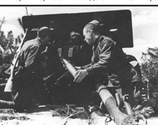
Расчёт орудия ЗиС-3 в бою

Не встречая сопротивления, немцы приблизились к Шидлуву с северо-запада и повернули на юг. Когда они оказались в 400 метрах от первой батареи, вторая, расположенная дальше, отвлекла на себя внимание, открыв огонь.