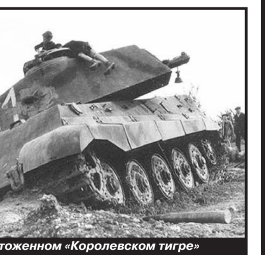
Дети играют на уничтоженном «Королевском тигре»

В последующие дни бои на этом участке продолжались. Эстафету борьбы именно с «Королевскими тиграми» приняли советские танкисты. 12 августа, находясь в засаде на Т-34-85, младший лейтенант А. Осыкин сжёг три из них. 13 августа отличились танкисты 71-