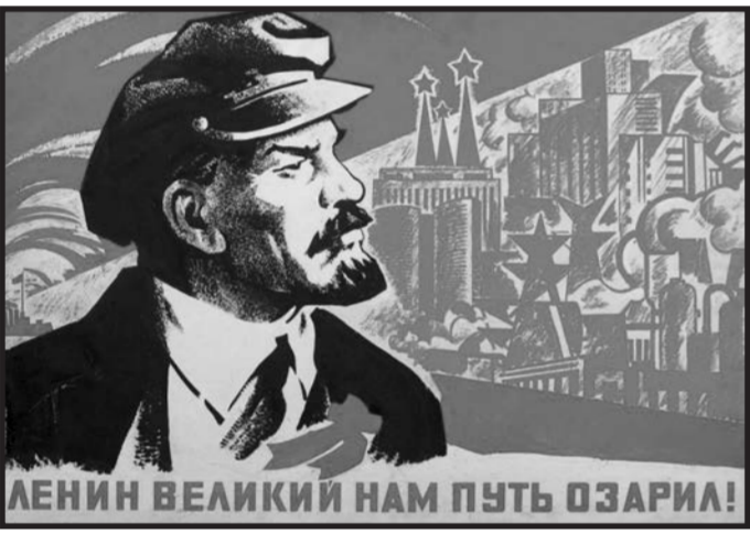
ЛЕНИН ВЕЛИКИЙ НАМ ПУТЬ ОЗАРЯ!

Каждый Законом Бытия обязан проявить свою истинную суть до конца! Положение будет ухудшаться, пока люди не поймут, что не деньги решают в мире, а сила Света — бессмертного, самоотверженного русского духа человека, и что Помощь можно приложить лишь к нашему действию и в самый последний момент, ибо на земле всё творится только «руками и ногами человеческими». Особенно теперь, на стыке Эпох, во время Великого Суда землян, когда каждый судит себя сам своими делами или бездействием. Ведь «под лежачий камень вода не течёт».