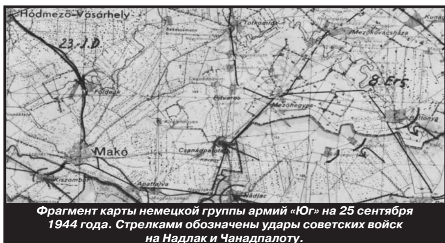
Фрагмент карты немецкой группы армий «Юг» на 25 сентября 1944 года. Стрелками обозначены удары советских войск на Надлак и Чанадпалоту.