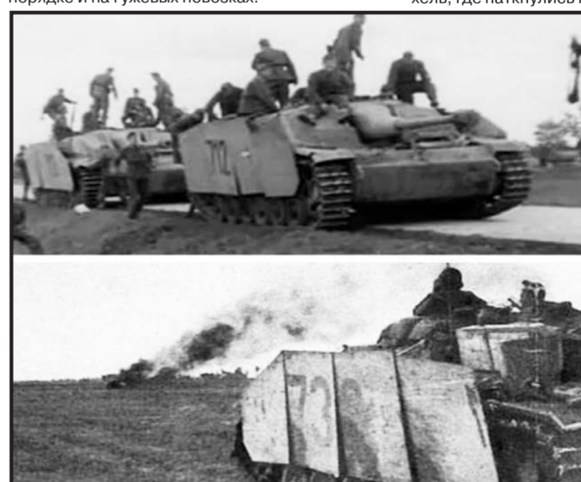
Немецкие штурмовые орудия StuG III на венгерской службе: самоходки 1-й и 3-й батареи 7-го батальона штурмовых орудий осенью 1944 года.

Теперь вернёмся к нашим событиям. Все имевшиеся в строю 18-го тк танки имели очень малый запас моторесурса и сильный износ ходовой части, так как прошли своим ходом с боями от Ясс до Арада более 2000 км, причём часть из них — в трудных горных условиях. При этом часть танкового парка 18-го тк, помимо новых Т-34-85, составляли старые Т-34 с 76-мм орудием. Автотранспортный корпус был укомплектован на 35%, из-за чего пехота 32-й мотострелковой бригады передвигалась в пешем порядке и на гужевых повозках.