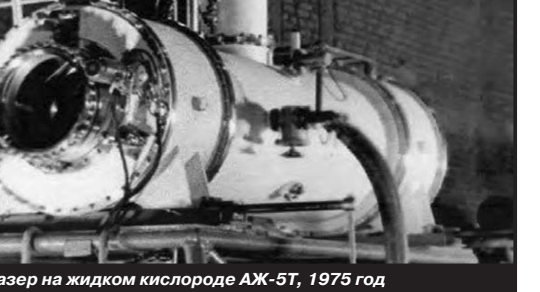
ВКР-лазер на жидком кислороде АЖ-5Т, 1975 год

Изучив установку, начиная с электроцепей в подвале и заканчивая транзисторными компьютерами 20-летней давности, а также лазером, который когда-то был назван разведывательным сообществом США действующим противоспутниковым оружием, члены американской делегации за-