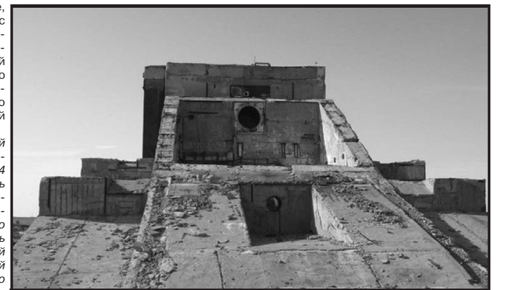
Руины комплекса 5Н76 («Терра-3») на полигоне Сары-Шаган; 2017 год

В конце 90-х годов Министерство обороны Российской Федерации прекратило все работы на полигоне, после чего часть объектов была уничтожена, а оставшаяся материально-техническая база передана в ведение Министерства обороны Республики Казахстан. С тех пор военное имущество, представлявшее хоть какую-то ценность, было демонтировано и разграблено, а на сохранившиеся руины возят туристов.