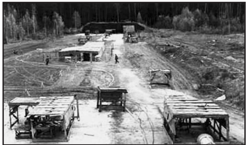
Полигон для испытаний фотодиссоционных лазеров ВНИИЭФ

После того как осенью 1969 года в составе Министерства оборонной промышленности было организовано ЦКБ «Луч», к реализации программы подключили многих видных учёных, что способствовало ускорению работ над мощными лазерами. На полигоне Сары-Шаган началось возведение комплекса, получившего обозначение 5Н76. Основные сооружения выполнялись из монолитного железобетона и особо прочных конструкций, чтобы выдерживать воздействие ударной волны и осколков, возникающих при одновременном срабатывании многих ВФДЛ. Предусматривалось, что общая масса взрывчатого вещества в лазерах может достигать 30 т. Здание системы наведения строилось на расстоянии километра от площадки лазеров, чтобы ударная волна достигала его только после того, как импульс уйдёт к цели. Излучение от ВКР-лазера к системе наведения предполагалось передавать по подземному каналу, соединявшему здания. Строительство шло довольно медленно, что позволяло вносить изменения в схему комплекса по мере изучения сложностей, которые выявляли эксперименты.