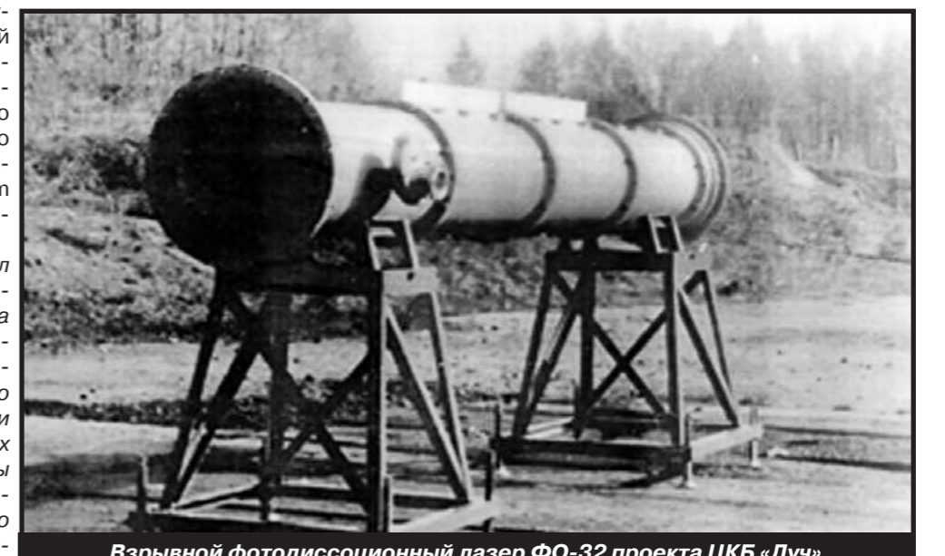
Взрывной фотодиссоционный лазер ФО-32 проекта ЦКБ «Луч»

Изучив установку, начиная с электроцепей в подвале и заканчивая транзисторными компьютерами 20-летней давности, а также лазером, который когда-то был назван разведывательным сообществом США действующим противоспутниковым оружием, члены американской делегации за-