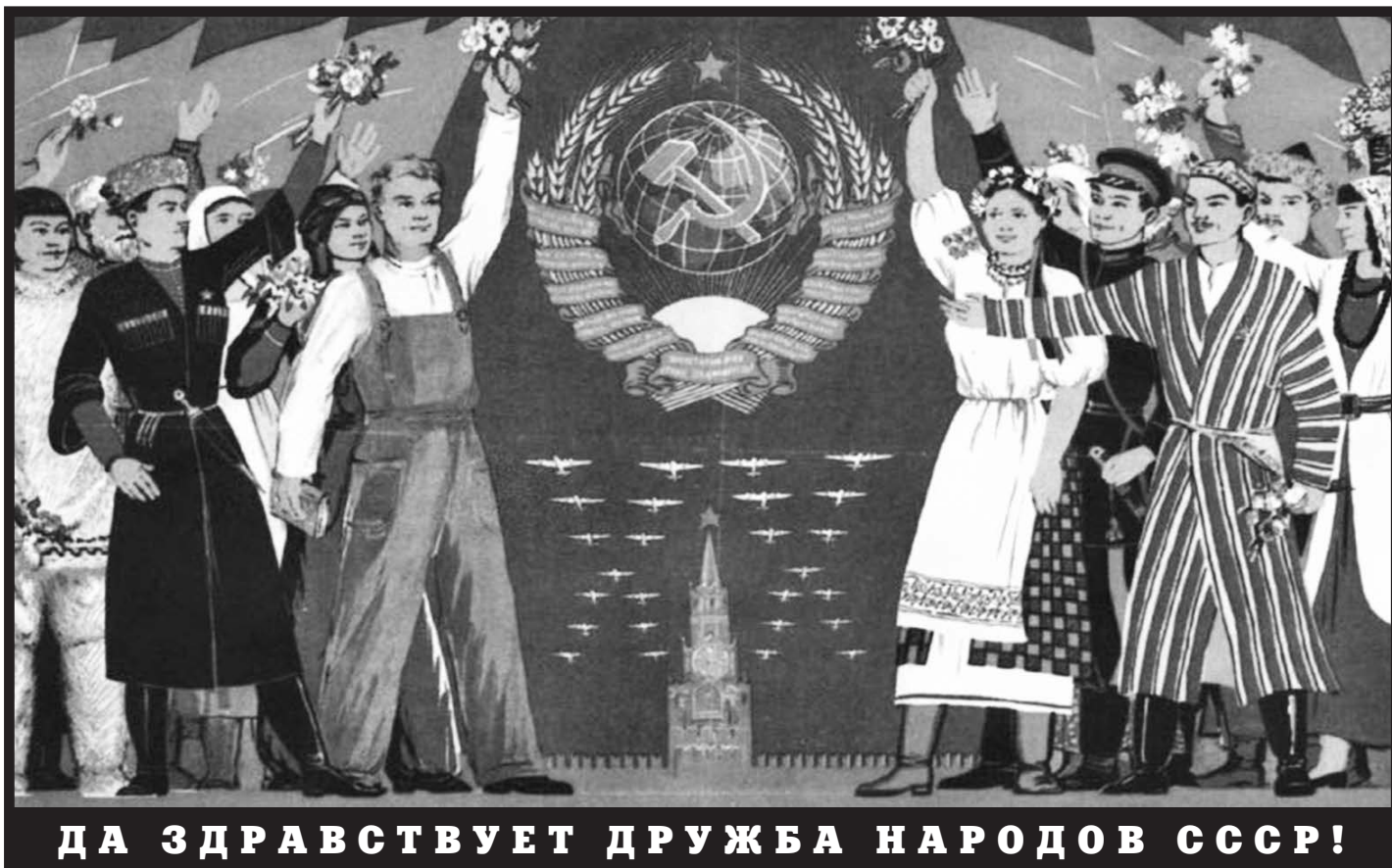
ДА ЗДРАВСТВУЕТ ДРУЖБА НАРОДОВ СССР!

Вне социализма нет спасения человечеству от войн, от голода, от гибели ещё миллионов и миллионов людей.