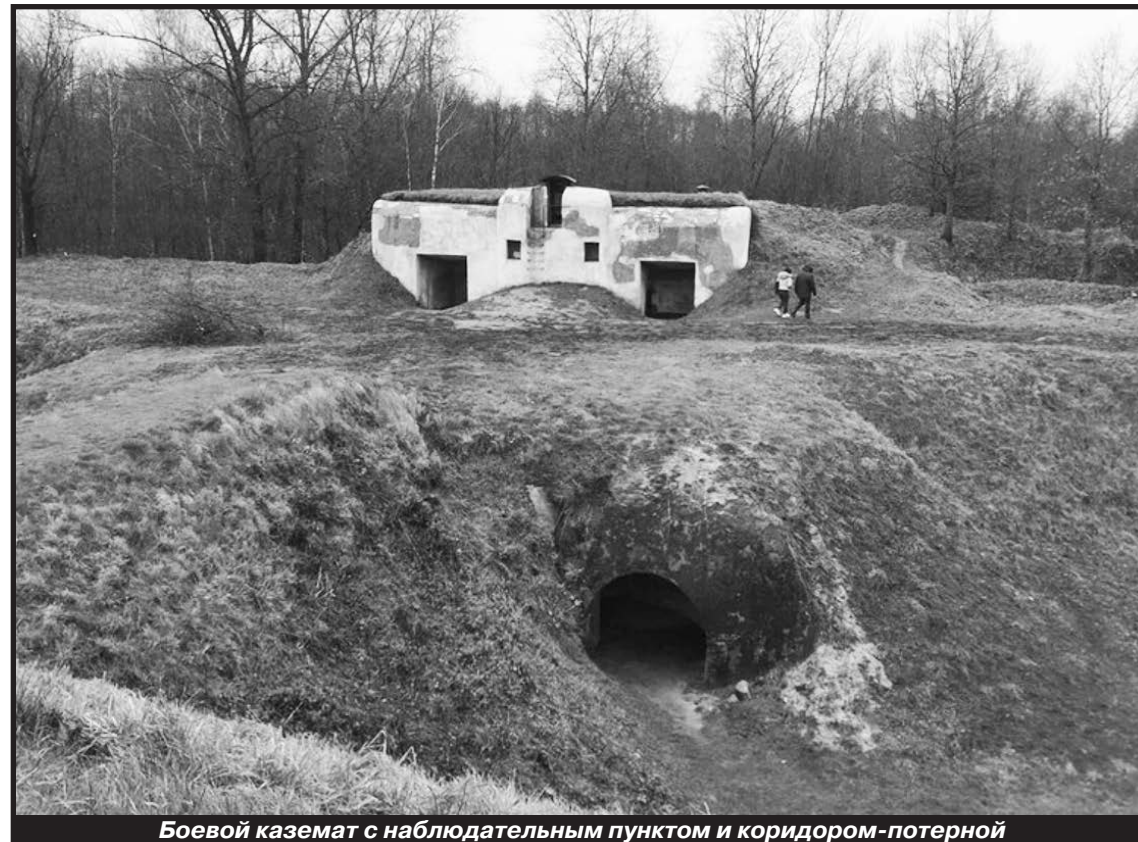
Боевой каземат с наблюдательным пунктом и коридором-потерней

Мемориальный комплекс «Брестская крепость-герой» можно уверенно назвать одним из самых динамично развивающихся музейных учреждений Белоруссии. За последние годы здесь создан (в том числе, за счёт финансовой поддержки Российской Федерации и спонсорских средств) целый ряд новых экспозиций, удачно раскрывающих различные стороны богатой истории Брестской крепо-