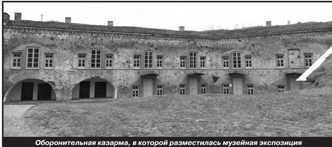
Оборонительная казарма, в которой разместились музейная экспозиция

Как хорошо известно, Восточный форт стал одним из очагов наиболее упорной и хорошо организованной обороны в Брестской крепости. Он пал лишь после массовой воздушной бомбардировки 29 июня, к 30 июня в плен сдались 389 красноармейцев и командиров. Перед этим защитникам удалось спрятать в одном из казематов знамя 393-го отдельного зенитного артиллерийского дивизиона. Драматичная судьба майора Гаврилова, покинувшего форт лишь 13 июля и попавшего в плен 23 июля, безусловно, заслуживает отдельного рассказа.