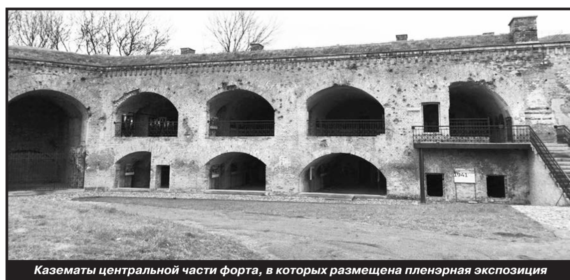
Казематы центральной части форта, в которых размещена пленэрная экспозиция

В отремонтированной и благоустроенной оборонительной казарме форта размещается классическая экспозиционная зона. Небольшая вводная экспозиция рассказывает о строительстве укрепления. Зал №1 «Штаб обороны. Партийное собрание» посвящён организации обороны форта и личностям защитников. Пространство стилизовано под красноармейскую казарму, напоминающую о последних мирных днях. Зал №2 «Госпиталь-лазарет» реконструирует импровизированный госпиталь, созданный защитниками форта в бывших конюшнях (казематы внешнего вала).