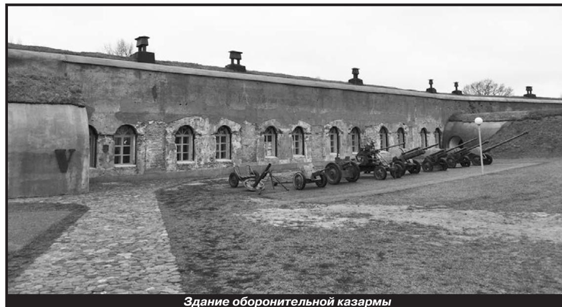
Здания оборонительной казармы

том не связано, однако он благополучно прошёл через все испытания XX века. В 1995 году форт №5 был включён в список историко-культурных ценностей Белоруссии, а в 1999 году стал филиалом мемориального комплекса «Брестская крепость-герой». С 2019 года проводилась реставрация и полная реконструкция форта №5, филиал вновь открылся для посетителей в январе 2021 года.