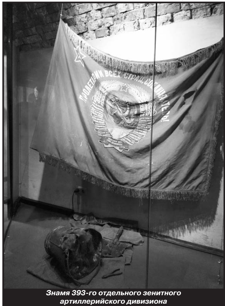
Знамя 393-го отдельного зенитного артиллерийского дивизиона

После героической обороны повреждённый Восточный форт не восстанавливался и был фактически заброшен. Ситуацию не изменило обнаружение в форте знамени 393-го отдельного зенитного артиллерийского дивизиона в 1956 году и открытие мемориального комплекса «Брестская крепость-герой» в 1971 году. Реставрация и музеефикация Восточного форта начались только в 2018 году, постоянная экспозиция под названием «Оборона Восточного форта» открылась в июле 2020 года.