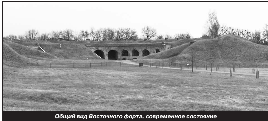
Общий вид Восточного форта, современное состояние

сти, в число которых достойно вошли Восточный форт и форт №5. Экспозиции отличаются корректной научной концепцией, высоким уровнем практической реализации и находятся на уровне современных мировых стандартов музейного дела. С учётом того, что Восточный форт и форт №5 имеют значительную историческую ценность сами по себе, их посещение стоит рекомендовать всем любителям военной истории.