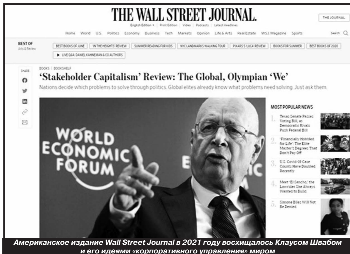
Американское издание Wall Street Journal в 2021 году восхищалось Клаусом Швабом и его идеями «корпоративного управления» миром