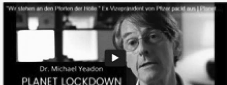
Заголовок статьи на портале uncut-news говорит сам за себя: «мы стоим на пороге ада бывший вице-президент Pfizer объяснил всё»