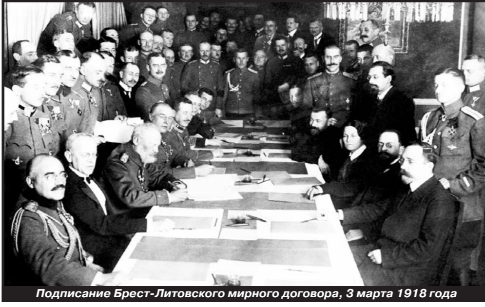
Подписание Брест-Литовского мирного договора, 3 марта 1918 года

Для молодой Советской республики 1919 год оказался тяжёлым: на юге шли бои с Деникиным, в Сибири – с Колчаком, а тут ещё с запада пожаловали белополяки. Россия пыталась провести в ними переговоры, предлагая уступить «справедливые границы по принципу расселения народов», однако Польша, уверенная в превосходстве, на переговоры не пошла. В мае 1920