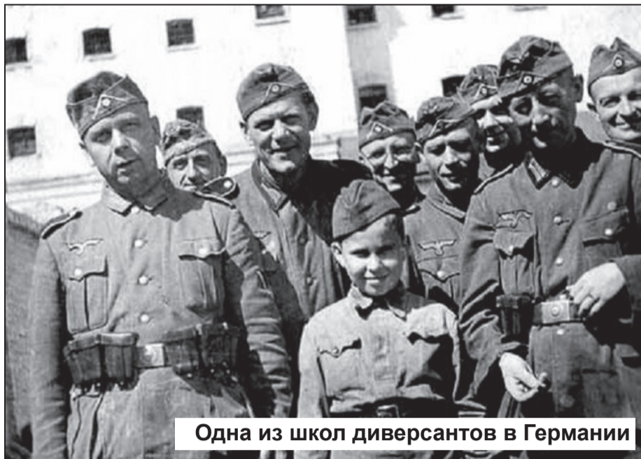
Одна из школ диверсантов в Германии

«Примерно в июле 1943 года к нам в детдом прибыли из бывшего МТС, расположенного в полукилометре от нас, немецкий унтер-офицер и старший лейтенант Красной Армии, находившийся в плену у немцев. Собрали нас всех, детдомовцев, и начали отбирать, которые повзрослее и старших возрастов. Набрали человек 12 – 13. После от-