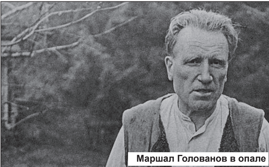
Маршал Голованов в опале

Хотя он действительно был лучшим летчиком Советского Союза, совершал героические перелеты, но все-таки основной его деятельностью были ответственные и секретные поручения самого Сталина, как в СССР, так и за рубежом. Даже в мемуарах, если читать внимательно, это проскальзывает. В трагические дни октября 1941, когда в Москве разразилась паника, именно Голованова Сталин отправил наводить порядок на дорогах и возвращать в столицу перетрусивших членов правительства.