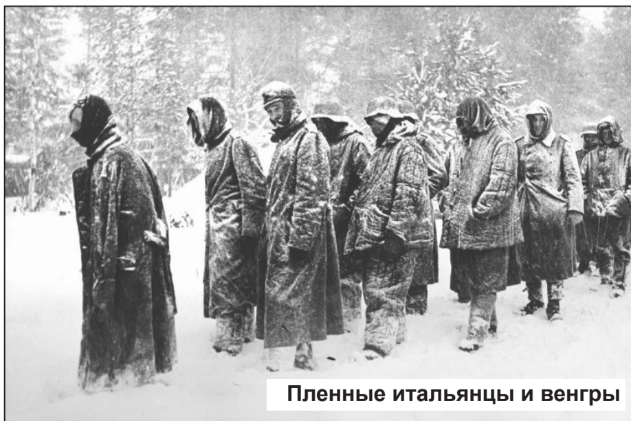
Пленные итальянцы и венгры

https://kajaleksei.livejournal.com/231946.html