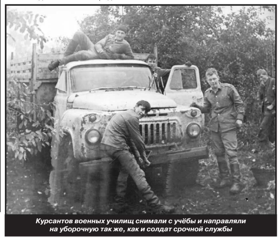
Курсантов военных училищ снимали с учёбы и направляли на уборочную так же, как и солдат срочной службы

Масштабы участия военных в уборочной кампании были таковы, что Министерство обороны СССР ежегодно готовилось к ней, как к настоящей боевой операции. Так, в 1970 году Минобороны всего выделило для оказания помощи сельскому хозяйству 102 тысячи автомобилей и около 210 тысяч человек. Максимальная численность военнослужащих, участвовавших в уборочной кампании, достигала 250 тысяч. Ответственным от Минобороны за отправку на «битву за урожай» автомобильных и ремонтно-восстановительных батальонов, а также подвижных ав-