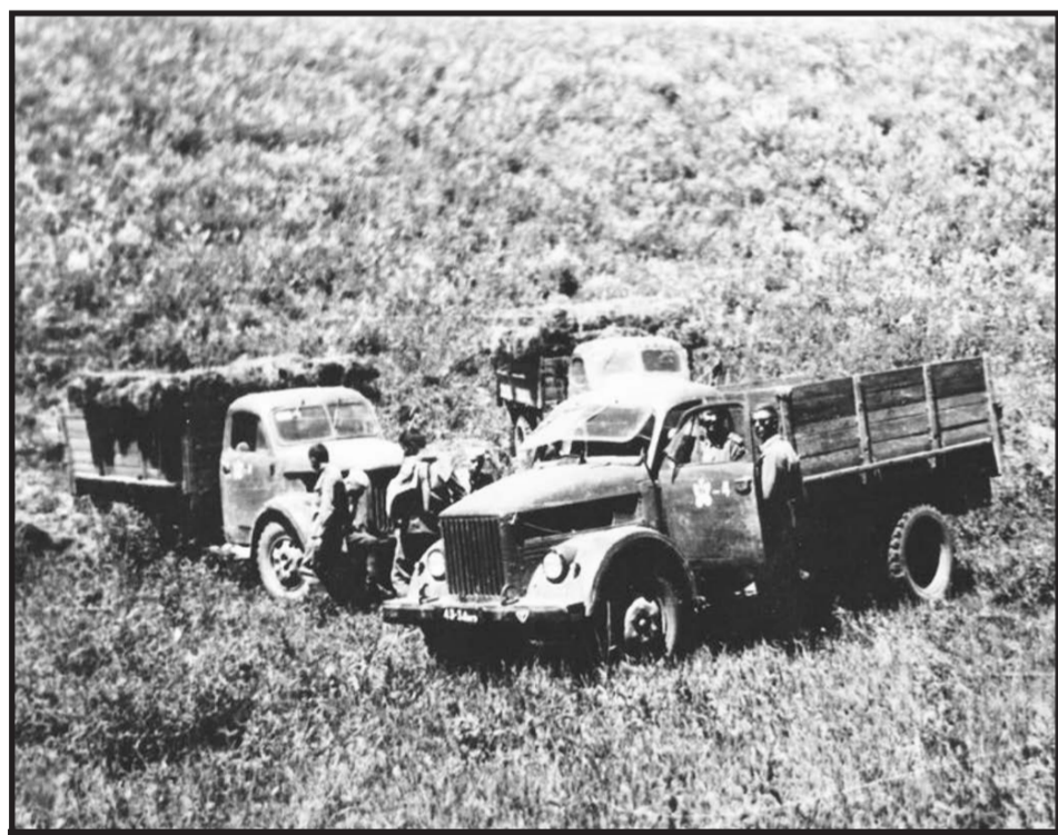
Личный состав и машины ГАЗ-63 отдельного автомобильного батальона на вывозке зерна с полей.

«Привлечение большого количества военнослужащих на работы не только нарушает нормальный ход боевой подготовки, понижает боевую готовность частей, но и создаёт ненормальное положение в организации караульной и внутренней служб, а также в уходе за оружием и обслуживании боевой техники. Кроме того, направленные на работы военнослужащие, будучи оторванными от боевой и политической подготовки и используемые рассредоточенными мелкими командами или одиночками, выходят из-под контроля своих начальников и разлагаются под влиянием окружающей обстановки. По возвращении в свои части они, как правило, являлись главными нарушите-