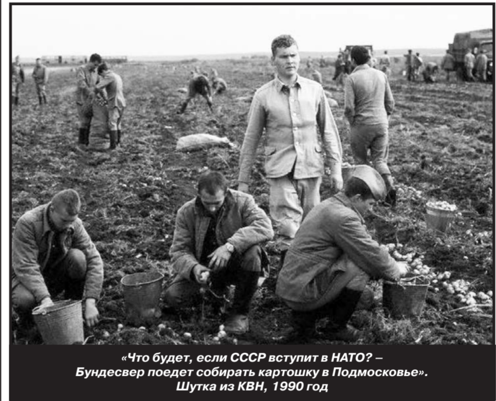
«Что будет, если СССР вступит в НАТО? – Бундесвер поедет собирать картошку в Подмоскowie». Шутка из КВН, 1990 год

новременно прибывала большая масса войск. Например, в Среднеазиатский военный округ ежегодно прибывали на работу несколько десятков автобатов – в среднем 50 тысяч автомобилей. В 1971 году их прибыло 54 тысячи, а в 1973 – даже 63,5 тысячи. Численность прибывавшего в Казахстан личного состава достигала 130 тысяч человек, временно увеличивая общую численность войск на территории округа почти вдвое. Размещение этой массы, покупка и обеспечение возлагались на принимающий округ. Он же обеспечивал связь с местными властями, начиная с ЦК компартии и совета министров республики и до председателей колхозов и совхозов. Поэтому нет ничего удивительного, что с таким опытом уборочных кампаний Среднеазиатский и Туркестанский военные округа успешно справились с задачами транзита и обеспечения войск, воевавших в Афганистане.