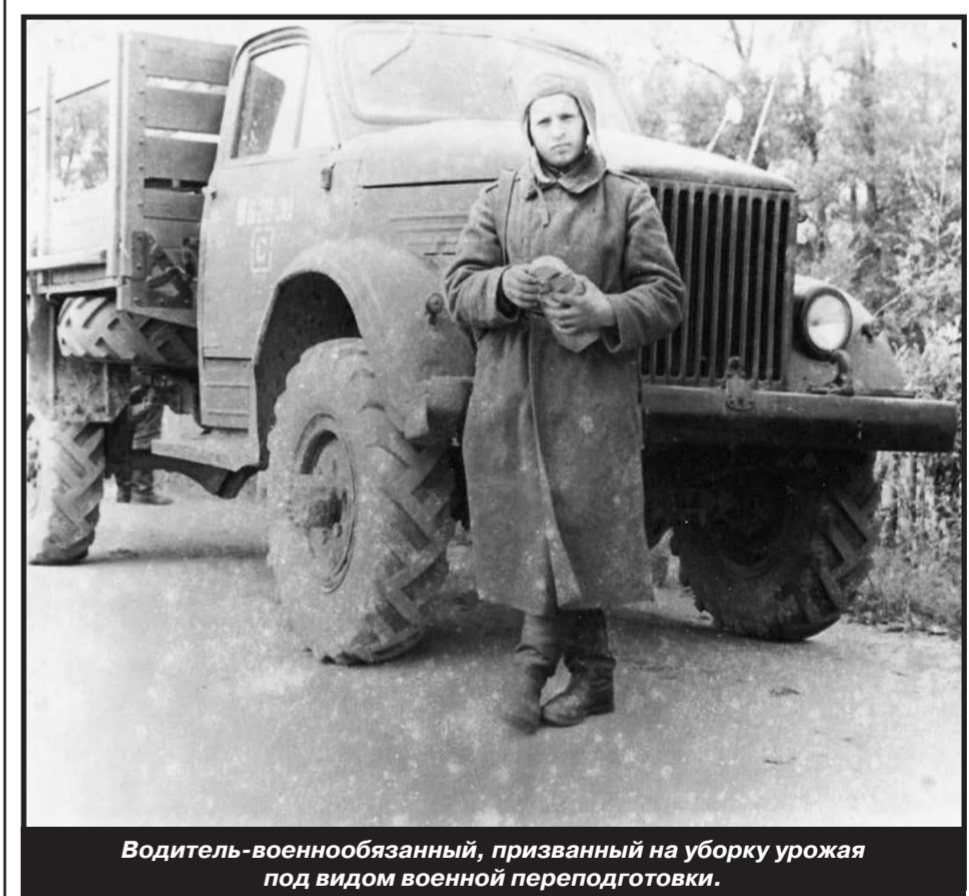
Водитель-военнообязанный, призванный на уборку урожая под видом военной переподготовки.

Чтобы вконец не разрушить систему боевой и мобилизационной готовности, в Минобороны приняли соломоново решение: не изымать автомобили из войсковых частей, а направлять на уборочную новые машины, произведённые промышленностью для нужд армии, но ещё не распределённые с заводов в войска. В разное время такие машины составляли до 30% всего автомобильного парка опергрупп. Теперь проблема состояла в том, что войска, отдавая лучшее, сами оставались с неисправной и