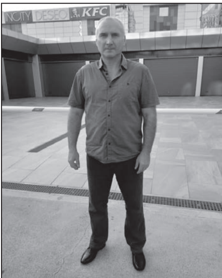
Я Душа, в теле живого мужчины из крови и плоти

Орфография и пунктуация автора сохранены.