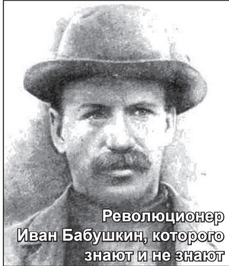
Революционер Иван Бабушкин, которого знают и не знают

Отбывшим наказание путь в большие города был заказан, и они селились в Сибири, будоража местные умы, посвящая их в идеи революционного движения. Прямые линии, прямые, как гвозди, по складу характера сибиряки «велись» не столько на байки о светлом будущем, сколько на рассказы о несправедливости жизни при деспоте-царе и ужасах самодержавия. Способствовала распространению революционных идей и социальная обстановка. Резкий приток населения произошёл при прокладке «сплошной» через всю Сибирь Транссибирской железнодорожной магистрали — Великой Сибирской железной дороги, как тогда говорили. После выхода в феврале 1891 года Высочайшего Указа о строительстве соединяемых в одну семи дорог: Западно-Сибирской, Средне-Сибирской, Кругобайкальской, Забайкальской, Амурской, Северно-Уссурийской и Южно-Уссурийской, на прокладку стали нанимать специалистов. С притоком высококвалифицированной рабочей силы в Сибирь переселилось и огромное количество неквалифицированных рабочих, благо рабочие руки требовались практически в неограниченном количестве. В процессе кто-то обучился и пошёл в железнодорожники, а кто-то так и остался на обочине жизни. За исходное тридцатилетие уходящего века пришло население юга Сибири устроилось.