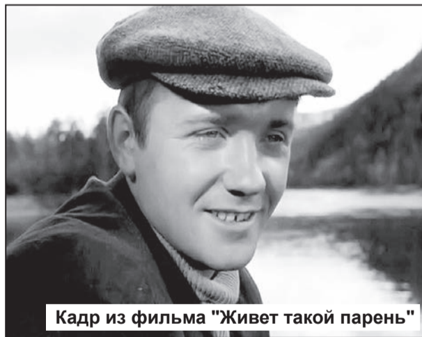
Кадр из фильма “Живет такой парень”

“Начало” - конечно же, центральной фигурой этой кинокартины является обожаемая мною Инна Чури-