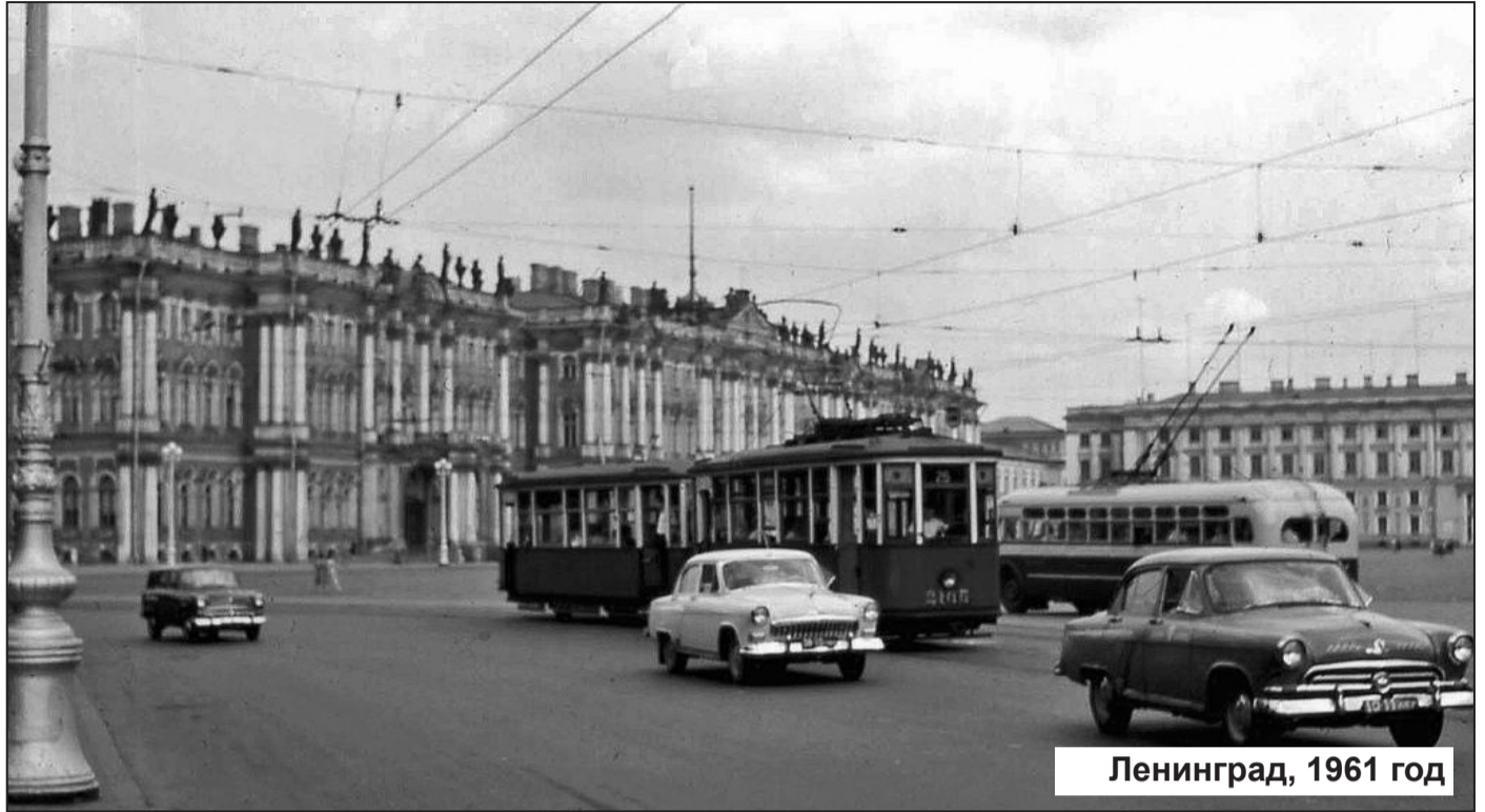
Ленинград, 1961 год

Самое славное в нашем городе – не его мистика и таинственность, не его державный размах,