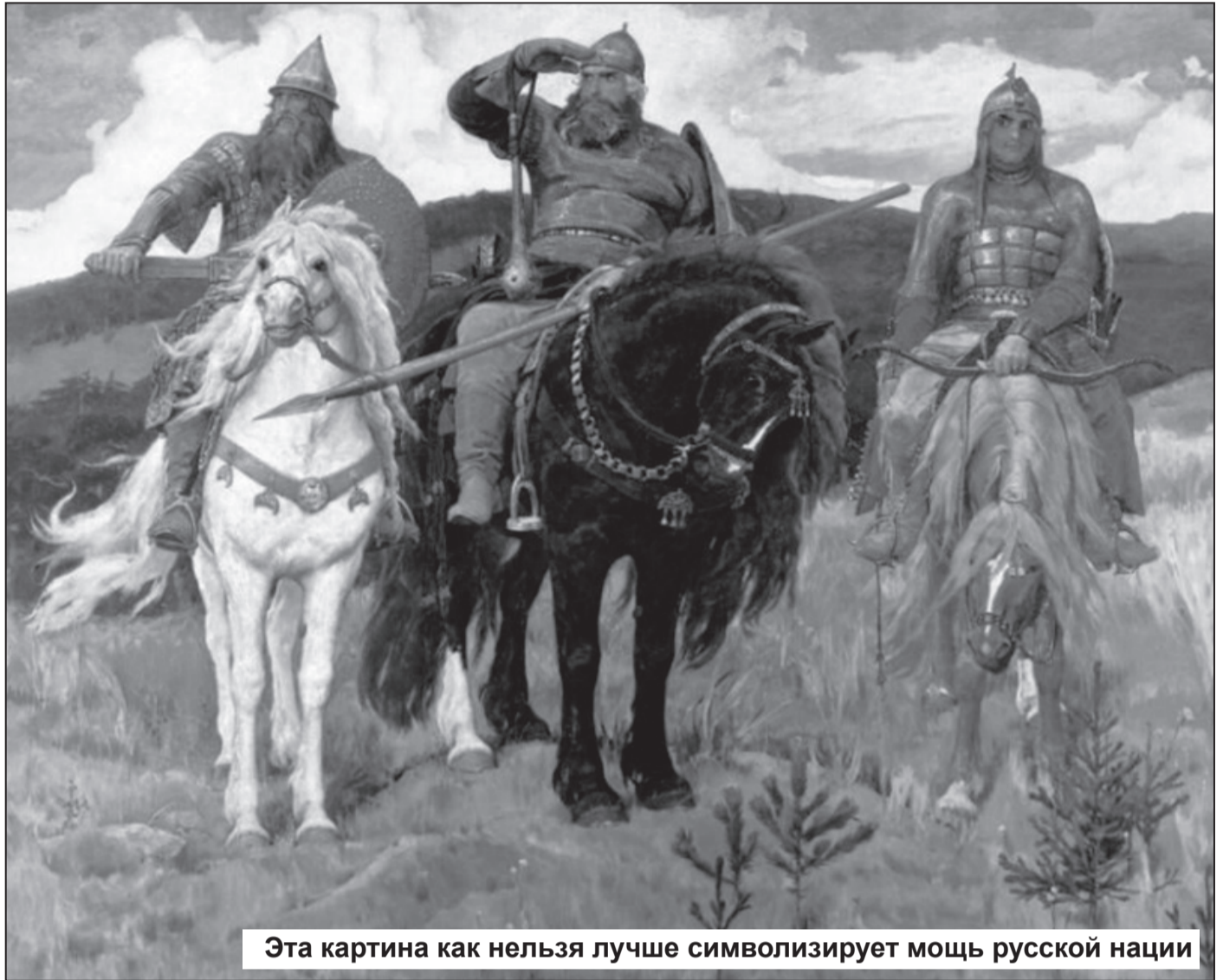
Эта картина как нельзя лучше символизирует мощь русской нации

А теперь посмотрим, какие страны никогда не празднуют День Независимости. Таких мало, в основном это страны Европы, и это опять-таки те же Испания с Португалией, Франция с Англией,