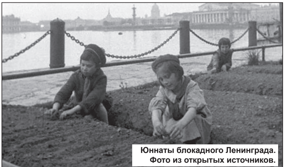
Юннаты блокадного Ленинграда. Фото из открытых источников.

https://m.zen.yandex.ru/media/ava/iunnaty-i-strannye-bolshevik-5e6bb72c720e971242d3c630