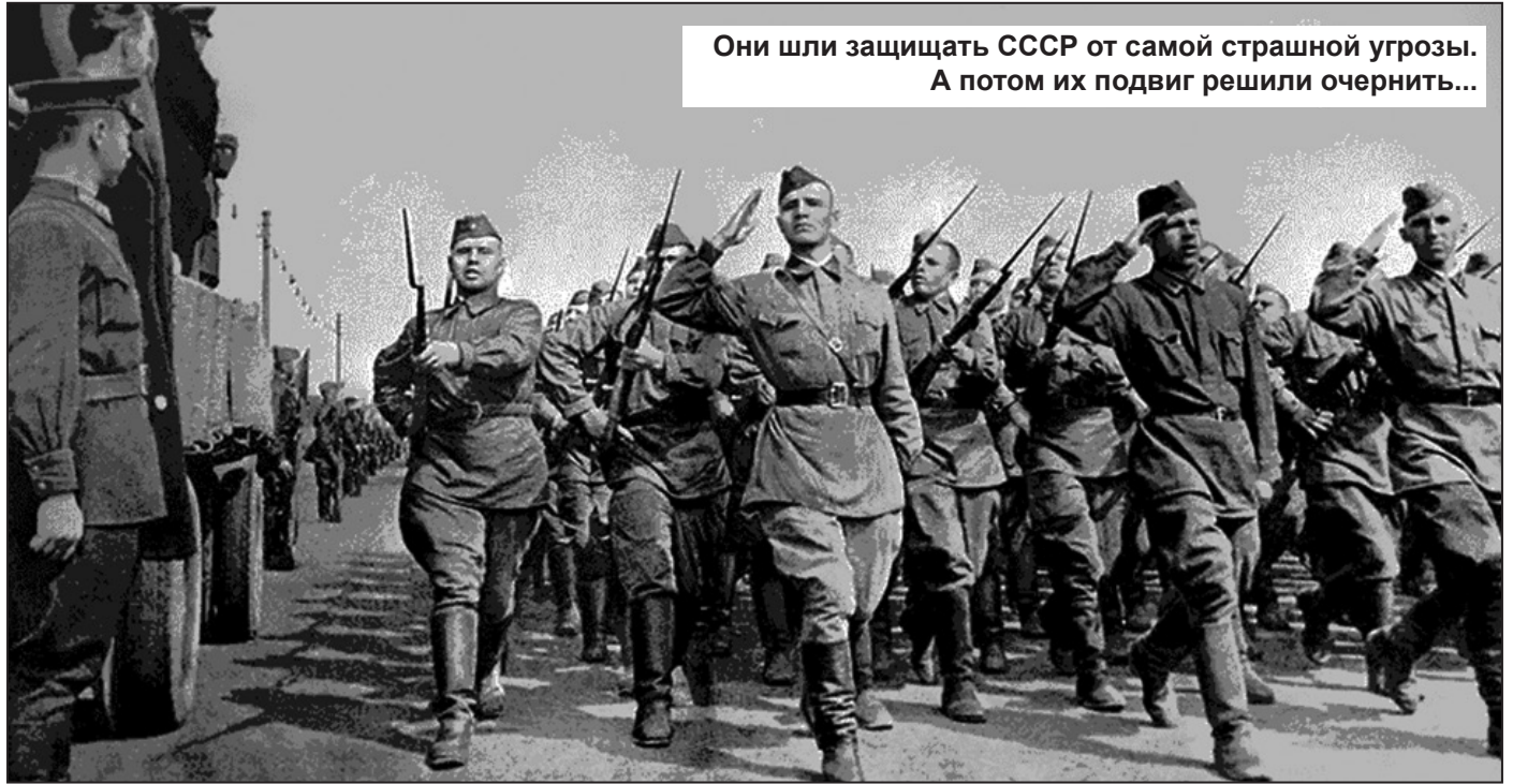
Они шли защищать СССР от самой страшной угрозы. А потом их подвиг решили очернить...

Ну что сказать... Заградотряды на самом деле были – это факт. Но – были ли такие вещи, как это начали рассказывать в разного рода «исторических произведениях» после 1991-го года? Может быть, кто-то сможет рассказать, чем именно должны были заниматься заградотряды на самом деле и чем они занимались – на самом деле?