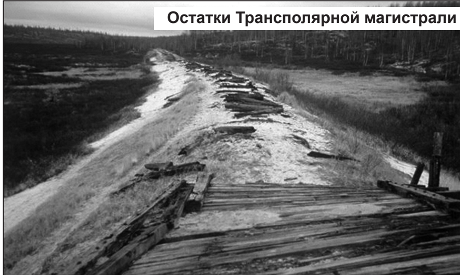
Остатки Трансполярной магистрали

Этот грандиозный проект не был принят по чисто экономическим соображениям. В начале 1930-х, когда он разрабатывался, предположения о богатых залежах полезных ископаемых на Севере были лишь чисто гипотетическими. Да и технологии добычи были крайне далеки от современных. Кроме того, стройка должна была осуществляться в крайне сложных природных условиях и в малонаселенных или вовсе безлюдных районах. Словом, Великий Северный железнодорожный путь казался вложением в столь далекое будущее, что взяться за него