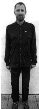
Божественный бессмертный дух

Божественный бессмертный дух С собственным именем Светодар Вступаю в должность Генерального исполнителя имущества моего Божественного доверия