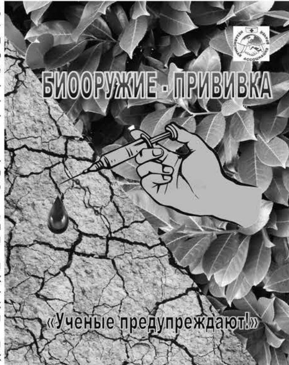
Серия «Ученые предупреждают» БИООРУЖИЕ - ПРИВИВКА Составитель С.В. Бояринцева, 2020 год, 116 стр.

Во время пика COVID-19 многие клиники в Европе и США оставались незаполненными или почти пустыми, в некоторых случаях приходилось отправлять персонал домой. Миллионы операций и процедур были отменены,