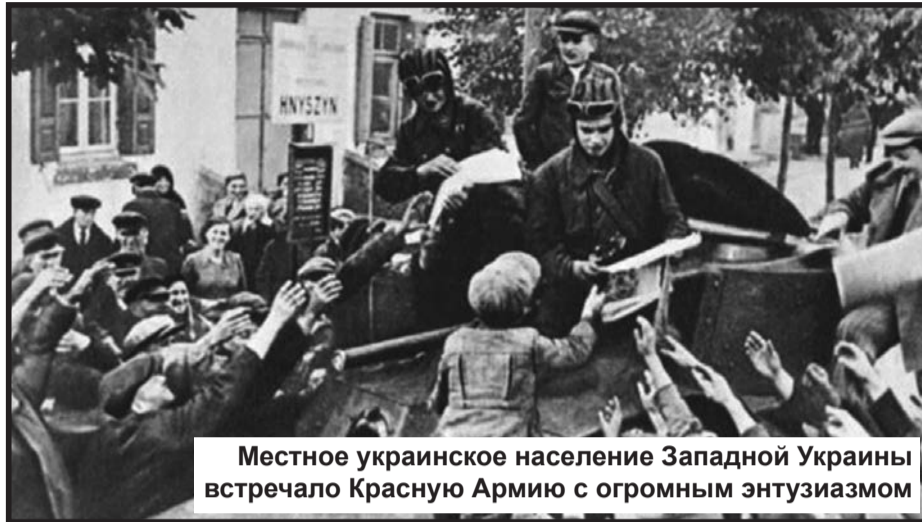
Местное украинское население Западной Украины встречало Красную Армию с огромным энтузиазмом

Теперь следует рассмотреть, что же происходило в это время на землях Восточной Польши, которые не были оккупированы немецкими войсками. Почему-то мало кто из «историков» об этом говорит, хотя все данные есть в свободном доступе. Пока немцы захватывали западные земли Польши, на юго-востоке поднялось восстание украинцев против поляков. Конечно, это было не столь масштабное восстание, которое было бы способно изме-