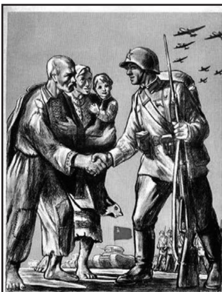
Подать руку помощи братским народам Западной Украины и Западной Белоруссии – наша священная обязанность!

Но дальше – больше. После того как Венгрия и Литва после недолгих раздумий отказались от сомнительной чести прирасти чужими территориями, Гитлер поручил своему главному разведчику (и контрразведчику) Вильгельму Канарису предложить украинским националистам создать на территории Западной Украины националистическое государство.