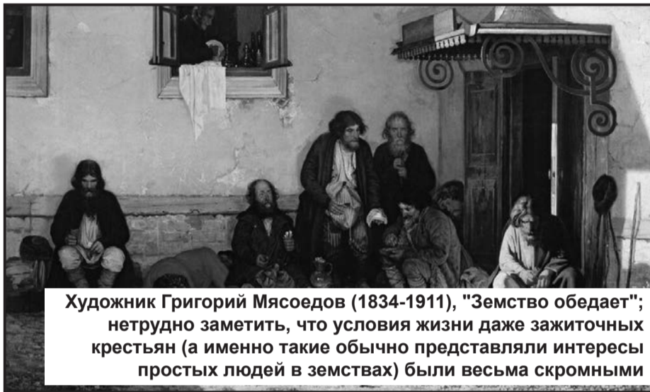
Художник Григорий Мясоедов (1834-1911), "Земство обедает"; нетрудно заметить, что условия жизни даже зажиточных крестьян (а именно такие обычно представляли интересы простых людей в земствах) были весьма скромными

То есть в среднем за 35 лет земля каждый год прибавляла в стоимости 4,5% в год, а на рубеже XIX-XX веков - даже 7% в год! Чудовищный рост! Реальная ин-