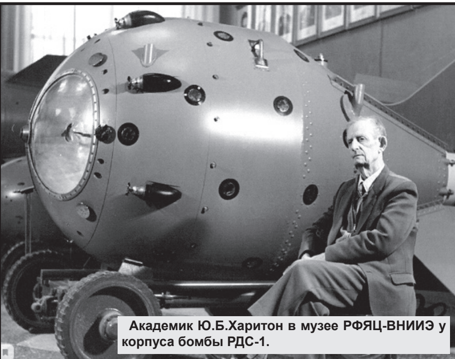
Академик Ю.Б.Харитон в музее РЯЦ-ВНИИЭ у корпуса бомбы РДС-1.

https://zen.yandex.ru/media/id/5e4d49628c0a1879703edafc/pochemu-sssr-tak-bystro-vosstanovilsia-posle-voiny-61141718668b916db7df7f46