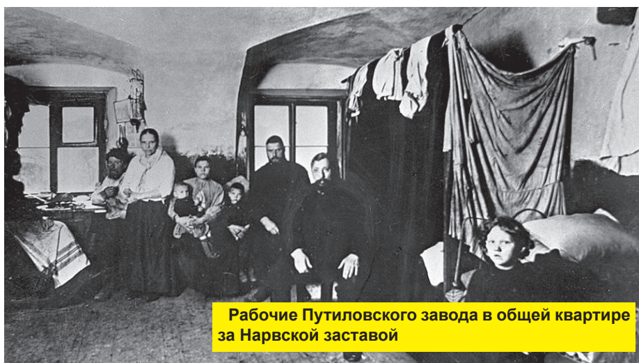
Рабочие Путиловского завода в общей квартире за Нарвской заставой