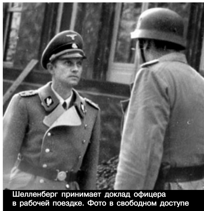
Шелленберг принимает доклад офицера в рабочей поездке. Фото в свободном доступе

С Вами был Владимир, канал «Две Войны». zen.yandex.ru/media/two_wars/gitler-prochel-doklad-i-skazal-chush-potom-on-ob-etom-pojalel-pervyi-nemec-kotoryi-ponial-chto-sssr-ne-pobedit-chto-on-uznal-62a90be19bc8c101696be518