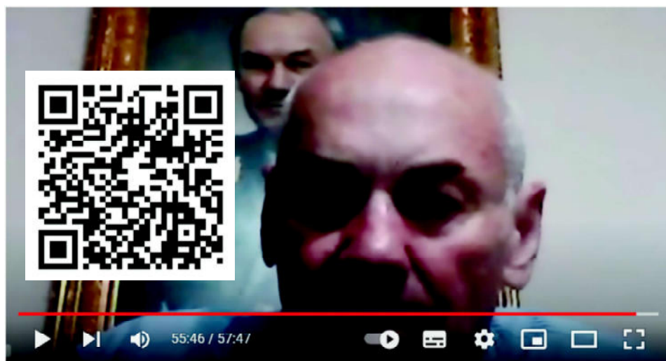
Генерал Ивашов: Путин должен уйти! На кону Россия!