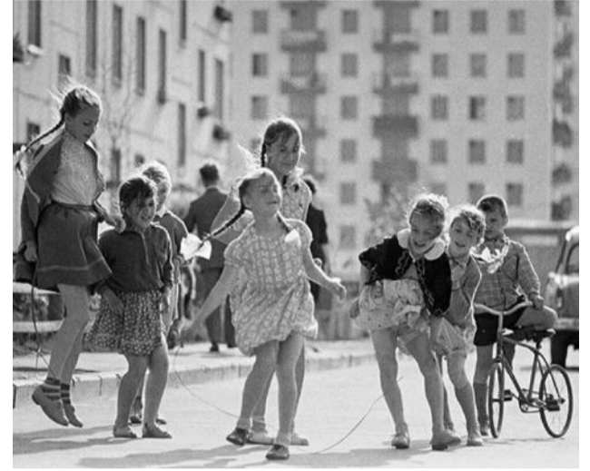
вкусное московское мороженое, а безопасность столичных улиц.

Когда знаменитый американский боксер, олимпийский чемпион Мухаммед Али побывал в Советском Союзе, его удивили не трескучие морозы, самое красивое в мире метро или самое