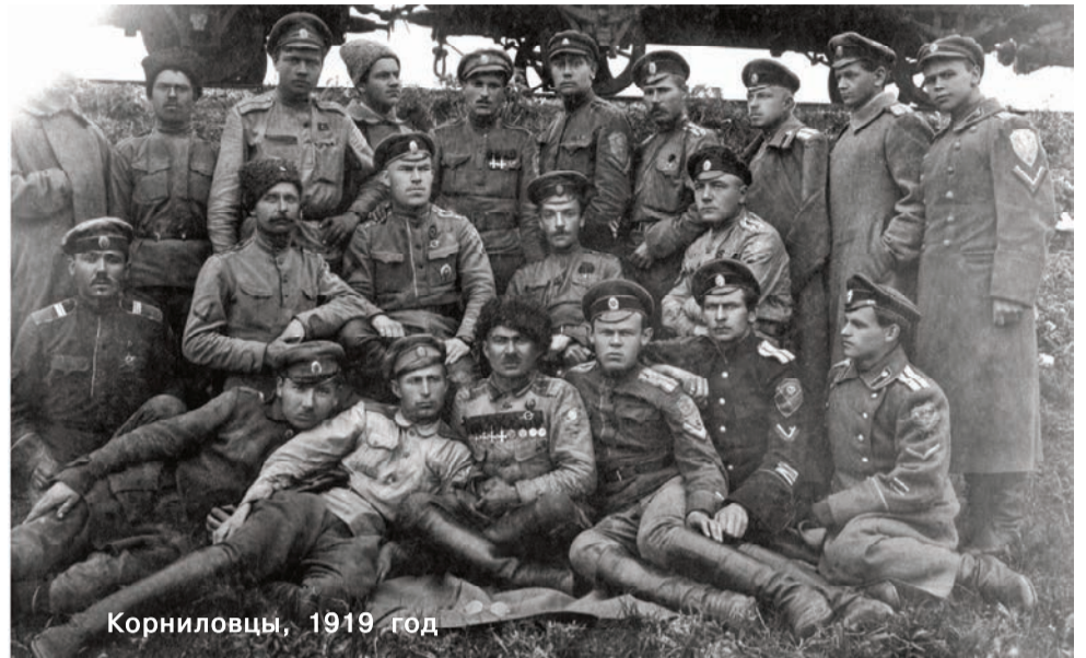
Корниловцы, 1919 год