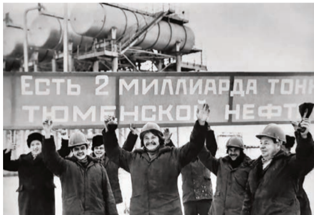
Это для нас делали наши отцы

По идее Путин должен сказать: «Всё, друзья, заработали, пора делиться и работать на страну».