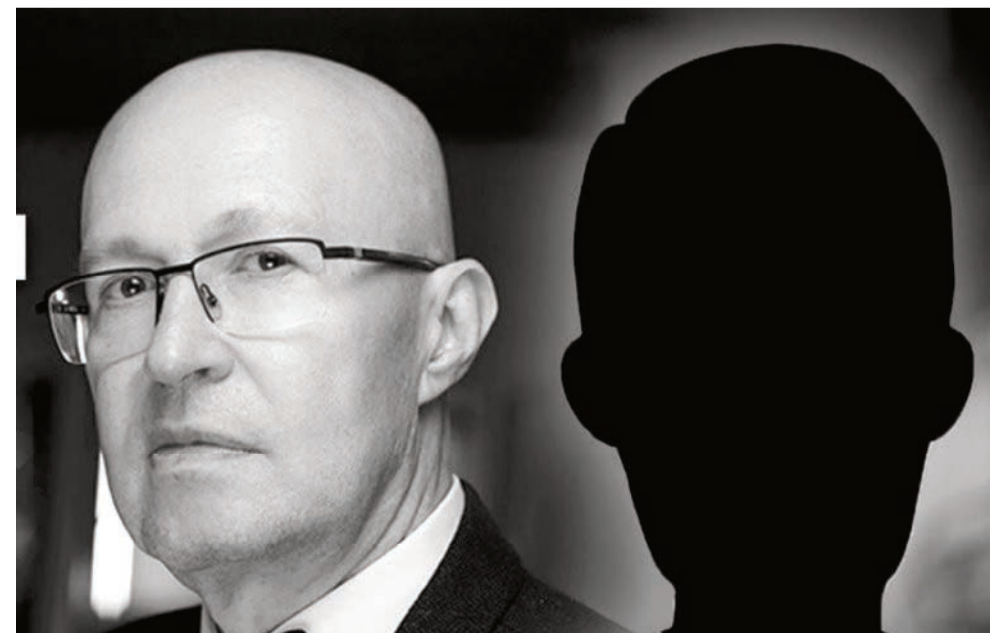
Соловей, «генерал СВР» и прочие действительно обладают инсайдом или связаны со спецслужбами РФ?