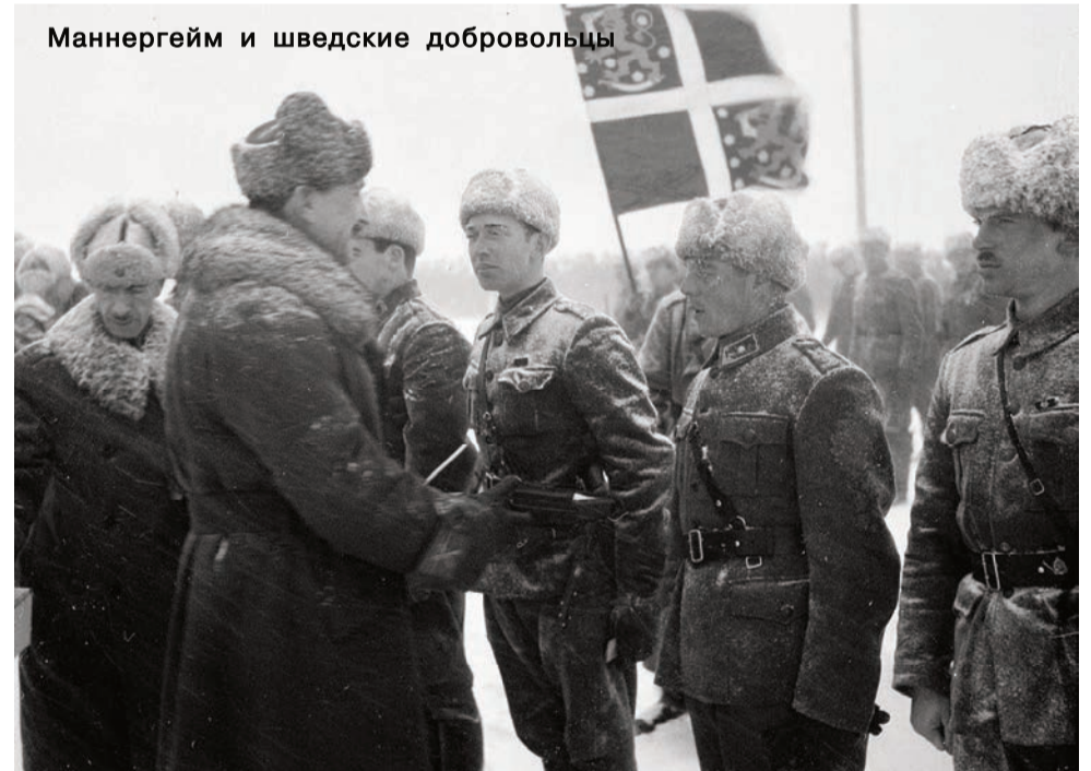
Маннергейм и шведские добровольцы