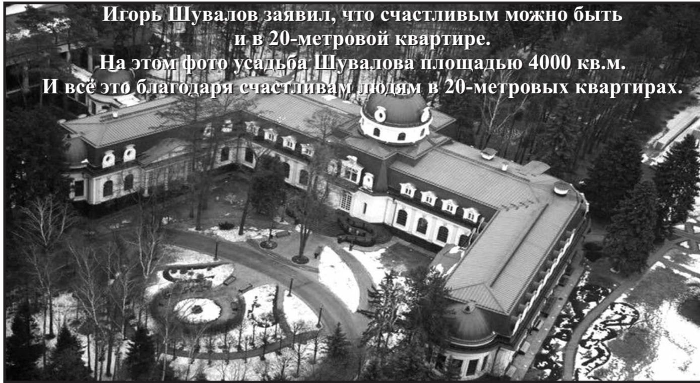
Игорь Шувалов заявил, что счастливым можно быть и в 20-метровой квартире. На этом фото усадьба Шувалова площадью 4000 кв.м. И всё это благодаря счастливым людям в 20-метровых квартирах.

держит социально-экономическое развитие Сирии. Нефть арабской республики привлекательна и Москве пора начать опасаться, что, выиграв войну, она проиграет потом Сирию экономически. Об этом рассуждает Михаил Мошкин в опубликованной газетой «Взгляд» статье «Станут ли Россия и Китай конкурентами в послевоенной Сирии».