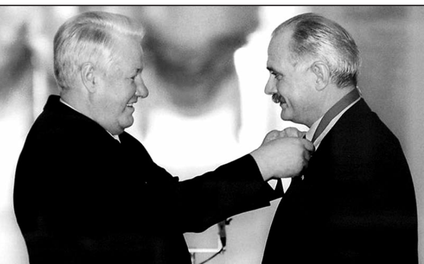
Никита Михалков (1996 год): «Поддерживая Бориса Николаевича Ельцина на президентских выборах, ему нет альтернативы. Он спас страну от катастрофы».

«Второй поступок, который я отношу к мужским поступкам, – это его добровольный уход». Ну просто король Лир, который добровольно всё отдал дочерям и ушел! А на самом деле это был вынужденный запоздалый уход на пенсию семидесятилетнего пожизненного алкоголика, перенесшего сложнейшую операцию на сердце. К тому же алкаш прекрасно знал, что на президентских выборах