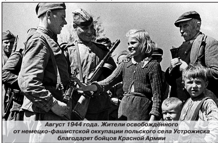
Август 1944 года. Жители освобождённого от немецко-фашистской оккупации польского села Устрожиска благодарят бойцов Красной Армии