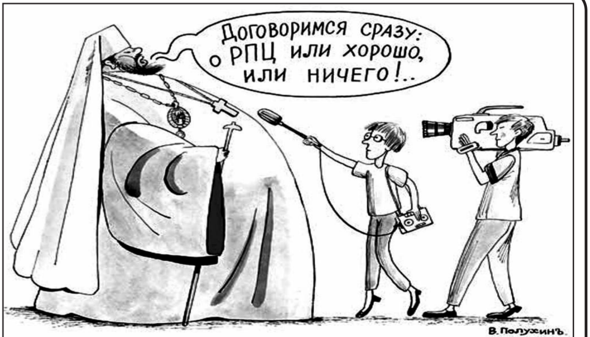
на все отвечает. Но Администрация президента тормозит», – сообщил собеседник.

«Епископ Тихон считается духовником Путина. Он пролоббировал назначение министра образования Васильевой и омбудсмена по правам ребенка Кузнецовой. Существует латентный, но очень напряжённый конфликт между Кириллом и Тихоном из-за влияния на президента. Эта ревность доведена до того, что патриарх звонит в Администрацию президента и спрашивает: «Почему президент встречался с Тихоном, а меня на встрече не было?». Хотя президент чувствителен к просьбам Кирилла,