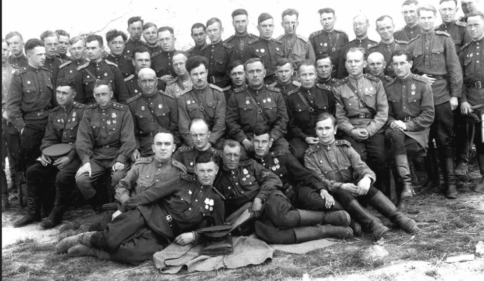
Лётчики 224 штурмовой авиадивизии

инского фронта с марта по август 1944 года лётчики 224 ШАД совершили 3500 боевых вылетов.