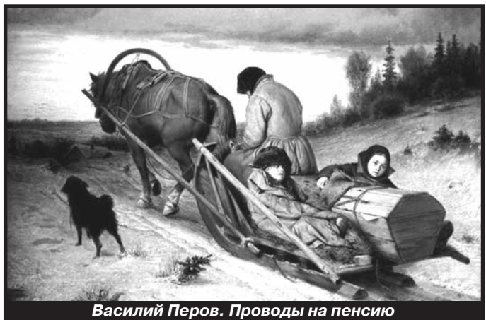
Василий Перов. Проводы на пенсию

На Change.org сбор подписей идёт рекордными темпами: число проголосовавших каждые сутки увеличивается примерно на 150 000. В петиции подчёркивается, что для повышения пенсионного возраста в России сегодня нет оснований, а проблемы дефицита и финансирования пенсионного фонда следует решать иным образом.