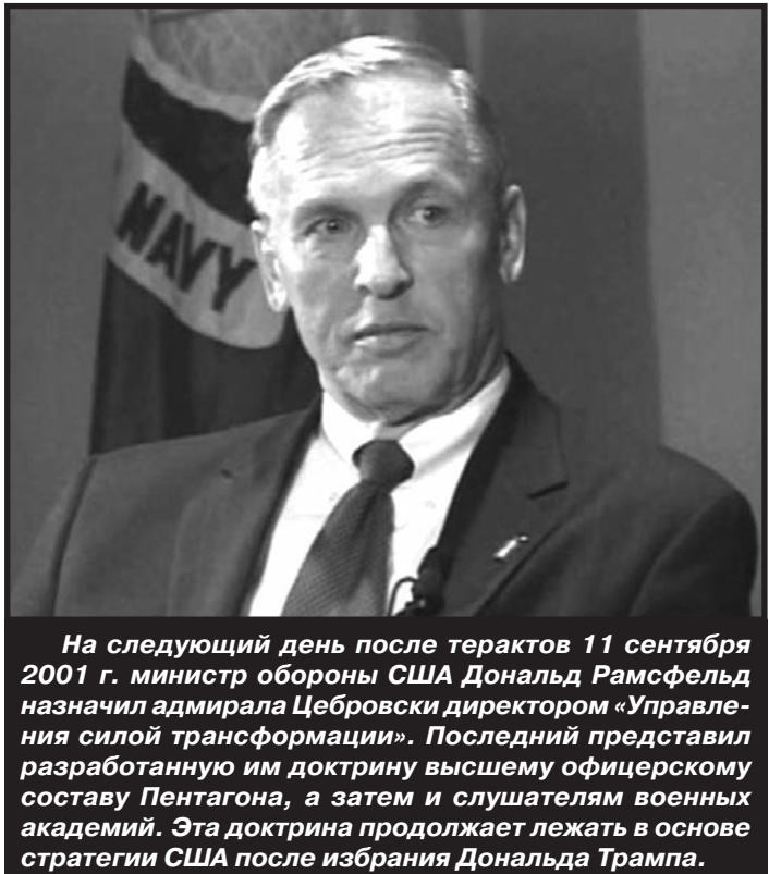
На следующий день после терактов 11 сентября 2001 г. министр обороны США Дональд Рамсфельд назначил адмирала Цевровски директором «Управления силой трансформации». Последний представил разработанную им доктрину высшему офицерскому составу Пентагона, а затем и слушателям военных академий. Эта доктрина продолжает лежать в основе стратегии США после избрания Дональда Трампа.

Но все эти вопросы вторичны по отношению к двум другим.