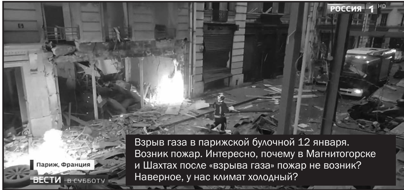
Взрыв газа в парижской булочной 12 января. Возник пожар. Интересно, почему в Магнитогорске и Шахтах после «взрыва газа» пожар не возник? Наверное, у нас климат холодный?

сионного возраста. Следующий шаг — уступка части Курил Японии. Дирижёром процесса самоутопления совокупного ВВП выступает Кириенко-Израиль. Коему никто не мешает — его даже награждают. Задача обрушения популярности Путина успешно выполнена, руками путинских же присных народные низы доведены до бешенства.